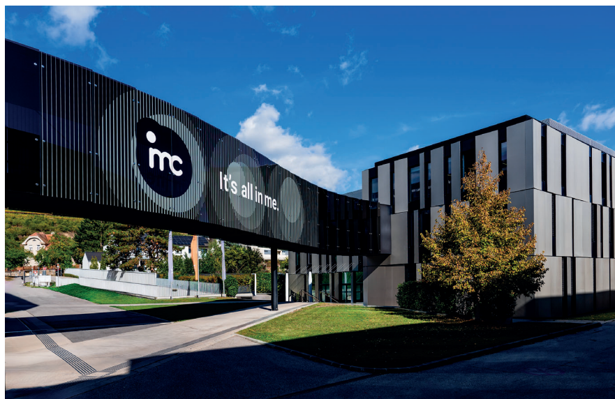
Der moderne Campus Krems erwartet die Chemietage 2026.