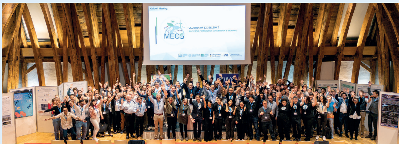
Kickoff Meeting MECS-Cluster.